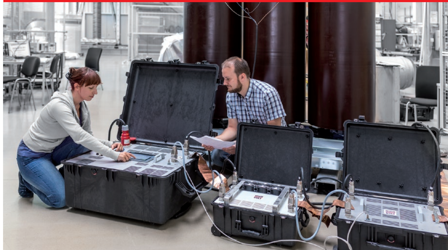
Fig. 1 Fuente portátil de ensayo WV 18-18/1.4