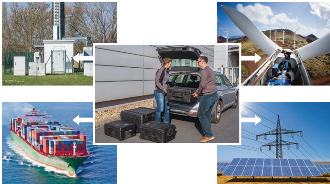
Fig. 3 Aplicaciones para la fuente de ensayo WV 18-18/1.4 para ensayar diferentes tipo de transformadores de distribución