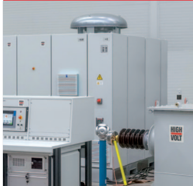
Fig. 1 Sistema de control totalmente automatizado y convertidor de frecuencia