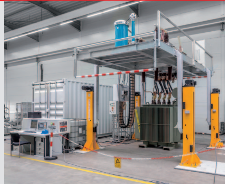
Fig. 2 Ejemplo mostrando la implementación práctica de un sistema de conmutación automática para un determinado cliente con ajuste de altura